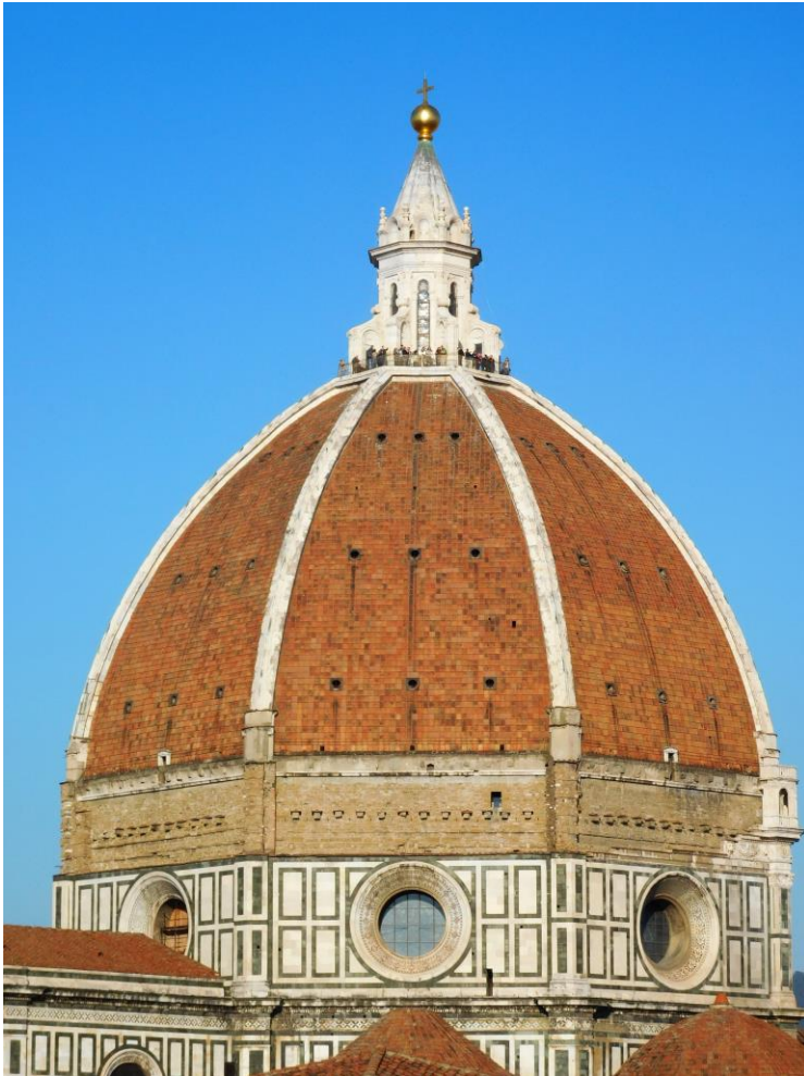
Imagen 1: Cúpula de Santa Maria del Fiore (Filippo Brunelleschi). Florencia, 1446.