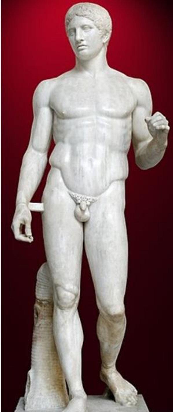
Imagen 4: Doríforo (Policleto). Mediados s.V a.C., copia en mármol del original en bronce.

Imatge 4: Dorífor (Policlet). Mitjan s. V a. C., còpia en marbre de l'original de bronze.