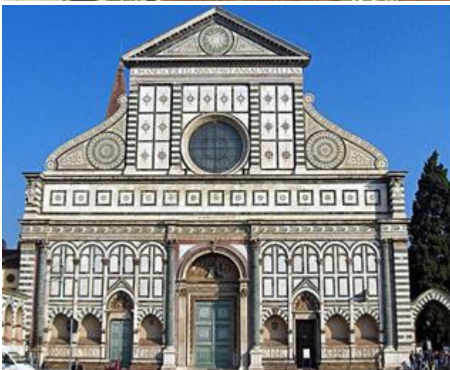
Imagen 2 / Imatge 2: Fachada Santa Maria Novella / Façana de Santa Maria Novella (Leon Battista Alberti). Florencia/Florència, 1470