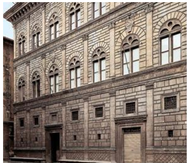
Imagen 3 / Imatge 3: Palacio Rucellai / Palau Rucellai (Leon Battista Alberti). Florencia/Florència, 1455.