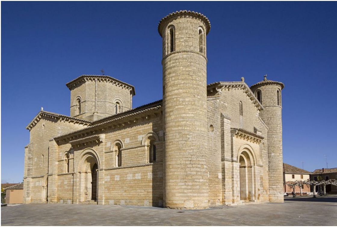
Imagen 1: Iglesia de San Martín de Frómista. S. XI. Imatge 1: Església de Sant Martí de Fròmista. S. XI.