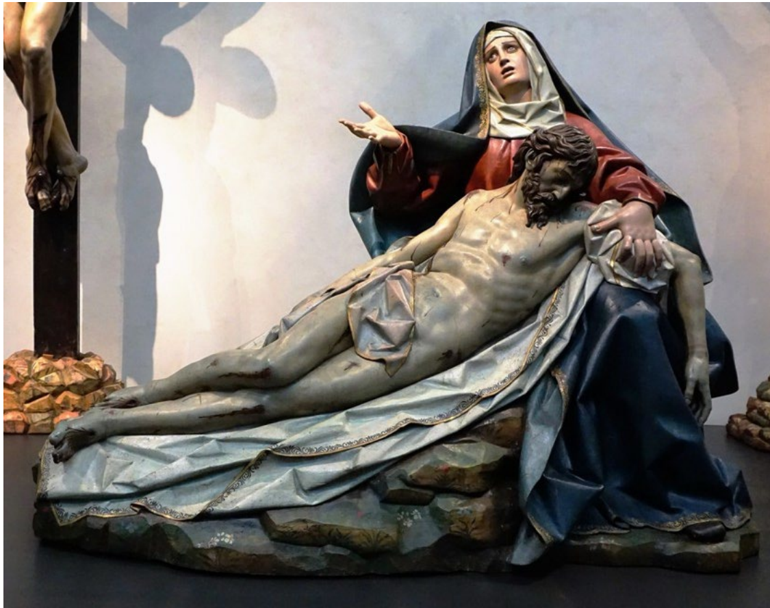
Imagen 4: Gregorio Fernández. 1616. Piedad . Imatge 4: Gregorio Fernández. 1616. Pietat .