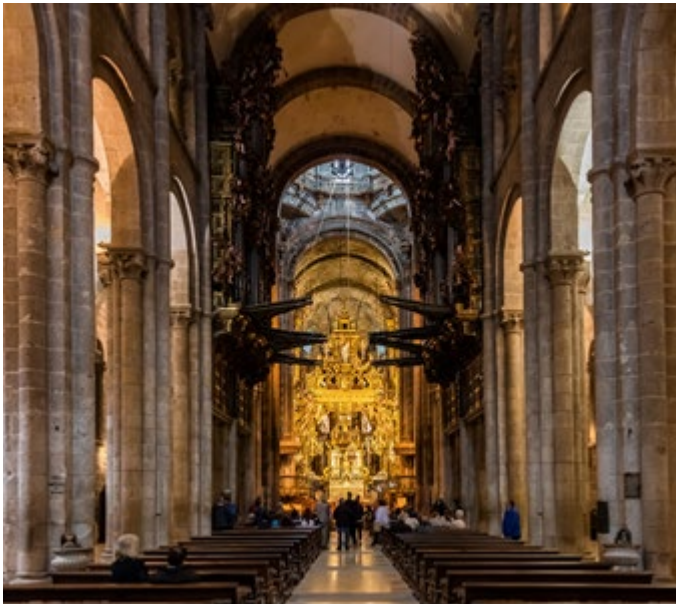
Imagen 2: Catedral de Santiago de Compostela (interior). S. XII. Imatge 2: Catedral de Santiago de Compostel·la (interior). S. XII.