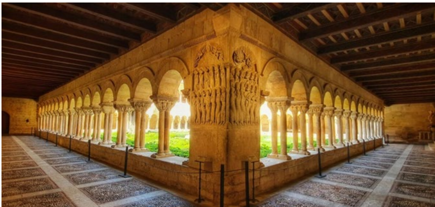
Imagen 3: Monasterio de Santo Domingo de Silos. Claustro. S. XI-XII. Imatge 3: Monestir de Santo Domingo de Silos. Claustre. S. XI-XII.