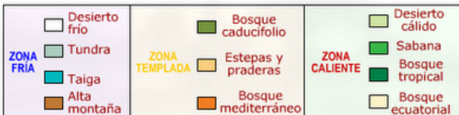
Distribució dels principals biomes terrestres Distribución de los principales biomas terrestres

Zona freda: zona fría Tundra: tundra Taigà: taiga Alta muntanya: alta montaña Zona temperada: zona templada Bosc caducifoli: bosque caducifolio Estepes i praderies: estepas y praderas Bosc mediterrani: bosque mediterráneo Zona càlida: zona caliente Desert càlid: desierto cálido Desert fred: desierto frío Sabana: sabana Bosc tropical: bosque tropical Bosc equatorial: bosque ecuatorial